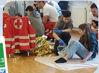
Erste Hilfe Kurs