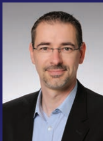
Dir. Christian Tröls