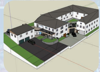
3D-Konstruktion mit Sketchup