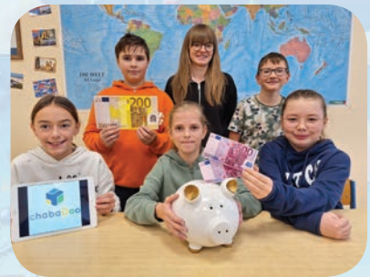
Wirtschaftsbildung als eigenes Fach