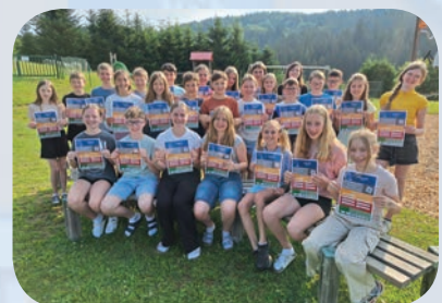
Urkunden für die ausgezeichneten Schulerfolge