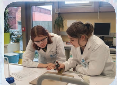
OpenLab der JKU