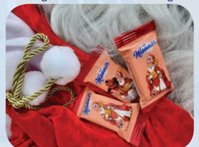
Gemeinsam Feste feiern